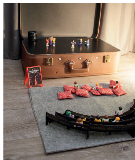
Deux configurations scénographiques : Théâtre classique ou scène contemporaine

pour les plus grands : approfondir leurs connaissances sur l'organisation d'un lieu culturel.